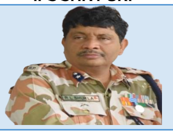
HON. RAJEEV LOCHAN SHUKLA DIG SHIVPURI (ITBP)