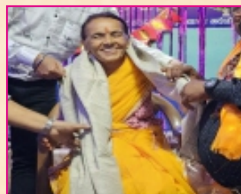
Gita Kumari Gautam Human Rights Activist, Nepal