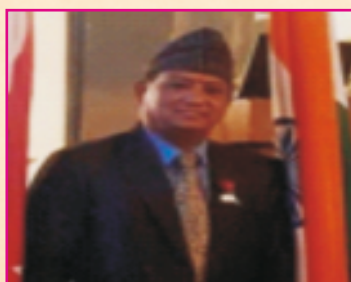
Shri Bhavesh Shresth Hon'ble Chairperson Nepal Tourism Board, Nepal