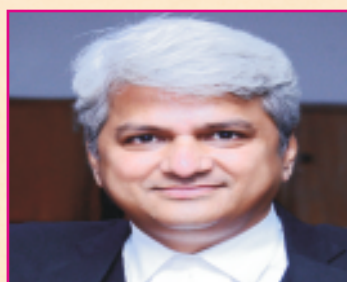
Honarary Secretary, Delhi High Court Bar Association