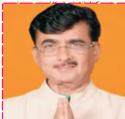
Hon. Kailash Chandra Gahtori Chairman State Forest Development Authority Uttarakhand (State Minister)