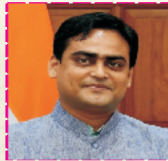
Hon. Shantanu Thakur Minister of State for Ministry of Ports, Shipping and Waterways of India