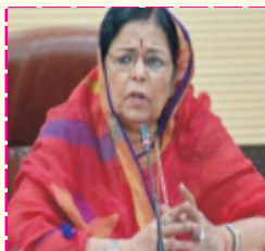
Hon. Smt. Anju Chaudhary State Vice Chairperson State Women Commission Uttar Pradesh (State Minister Protocol)