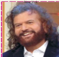
Hon. Padmashree Hansraj Hans Hon. Member of Parliament Indian Singer