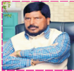
Hon. Shri Ramdas Athawale Hon. Minister of Social Justice and Empowerment of India