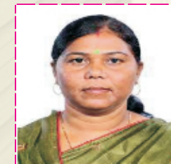
Hon. Smt. Gomati Sai Hon. Member of Parliament Raigarh, Chhattisgarh