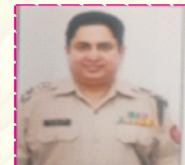
Hon. Shri A.K. Paswan Second -in-command Border Security Force Government of India