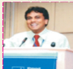
Hon. Dr. Manoj Gorkela Dy. Advocate General for State of Uttarakhand At Supreme Court of India Special Counsel-Govt. of MP, at Supreme Court of India