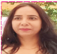
Hon. Smt. Sashi Tanwar Under Secretary Parliament Secretariat Parliament of India