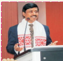
Hon. Mr. Raghavender G.R. Joint Secretary Department Of Justice Ministry of Law and Justice Government of India