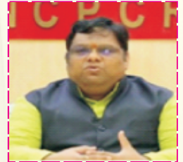
Hon. Priyank Kanoongo National Commission for Protection of Child Rights (NCPCR) Govt. of India