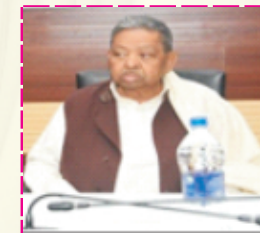
Hon. Shri Bhuneshwar Pd. Mehta Hon. Ex. Member of Parliament