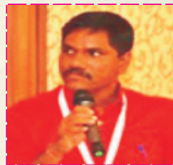
Hon. M. Venkatesan Hon. Chairman National Commission for Safai Karmacharis (NCSK) Govt. of India