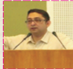
Hon. Vikramjit Banerjee Hon. Additional Solicitor General (ASG)