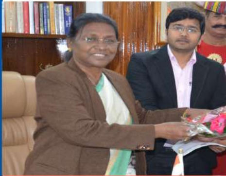
Smt. Draupadi Murmu Honourable Governor of Jharkhand