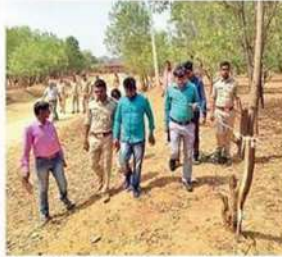
जंगल में काटे जा रहे पेड़ों को जंगल में ही छोड़ दिया जा रहा है।

खंभे के क्रम में हरछंडा जंगल के दक्षिण-पश्चिम कोट में काटे जा रहे हैं। जंगल में काटे जा रहे पेड़ों को जंगल में ही छोड़ दिया जा रहा है। जंगल में काटे जा रहे पेड़ों को जंगल में ही छोड़ दिया जा रहा है।