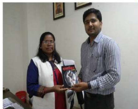
Smt. Arti Kujur Chairperson, State Commission for Protection of Child Rights