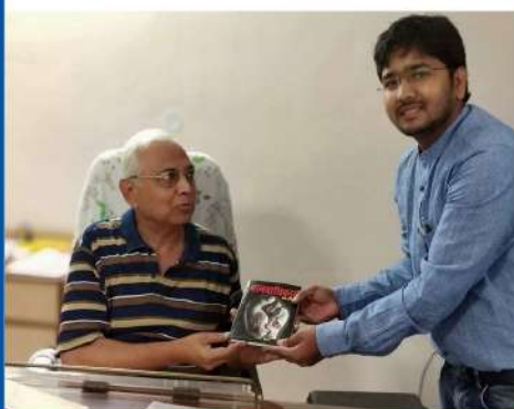
Justice R.K Merethia High Court, Jharkhand