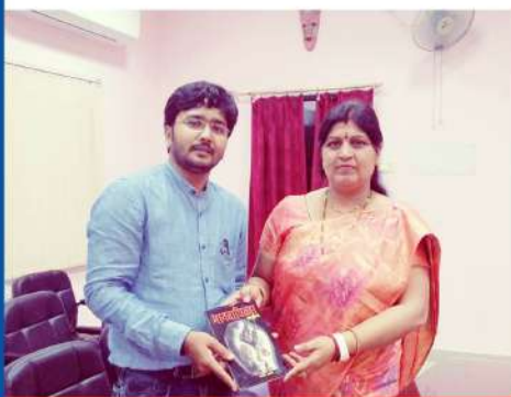
Smt. Neera Yadav Honourable Education Minister of Jharkhand