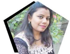
Subhani Raj National Women President