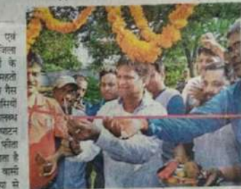
अध्यक्ष विधायक ने किया ट्रांसफार्मर का उद्घाटन

राष्ट्रीय मानवाधिकार एवं अपराध निरोधक ब्यूरो की पहल पर महिला आयोग द्वारा अस्पताल की जांच की गई। अस्पताल में घटित हो चुका यह घटनाक्रम काफी अजीब है। जहाँ सिद्धार्थ इंटरनेशनल स्कूल के छात्रों की सुरक्षा के नाम पर शिक्षिका को घायल कर दिया गया है।