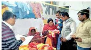
महिला आयोग के सदस्यों ने अस्पताल का जायजा लिया

राष्ट्रीय मानवाधिकार एवं अपराध निरोधक ब्यूरो की पहल पर महिला आयोग द्वारा अस्पताल की जांच की गई। अस्पताल में घटित हो चुका यह घटनाक्रम काफी अजीब है। जहाँ सिद्धार्थ इंटरनेशनल स्कूल के छात्रों की सुरक्षा के नाम पर शिक्षिका को घायल कर दिया गया है।