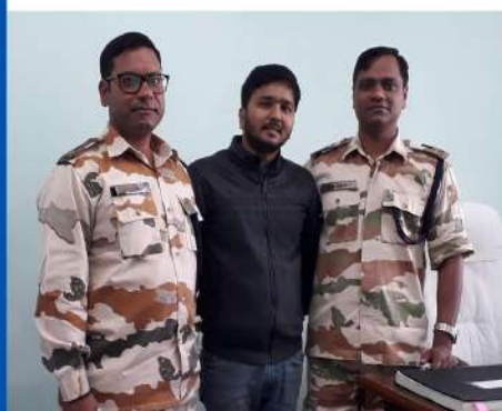
Deputy Commandant ITBP Ranchi Battalion