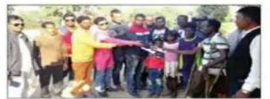
मृतक पारा शिक्षिका के परिवार से मिलने एनएचआरसीसीबी की टीम

जयपुर, 20 अक्टूबर : एनएचआरसीसीबी की टीम ने पारा शिक्षिका की मौत की जांच करने के लिए जयपुर पहुंची। टीम ने पारा शिक्षिका के परिवार से मिलने और मौत की जांच करने के लिए जयपुर पहुंची। टीम ने पारा शिक्षिका के परिवार से मिलने और मौत की जांच करने के लिए जयपुर पहुंची।