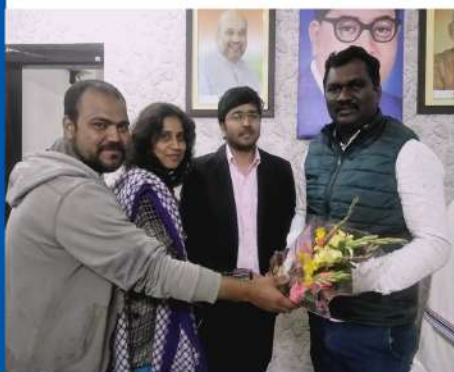
Shri. Amar Bauri Honourable Minister of Land Reforms, Art, Culture Sports & Youth Affairs, Jharkhand