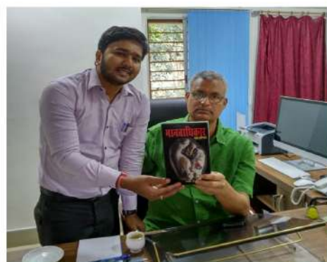
Chairman (I/C) State Human Rights Commission, Jharkhand