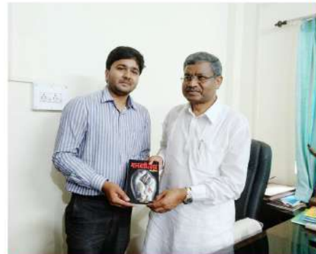
Shri. Babulal Marandi Former Chief Minister of Jharkhand