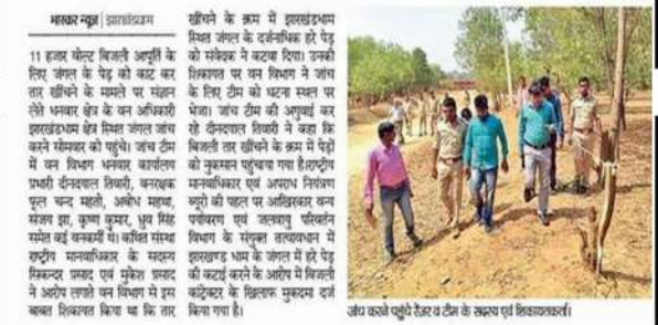
जयपुर में बिजली के खंभे लगाने के लिए काटे गए हरे पेड़

राजस्थान के राजसमंद जिले में बिजली के खंभे लगाने के लिए काटे गए हरे पेड़ों की तस्वीरें सामने आई हैं।